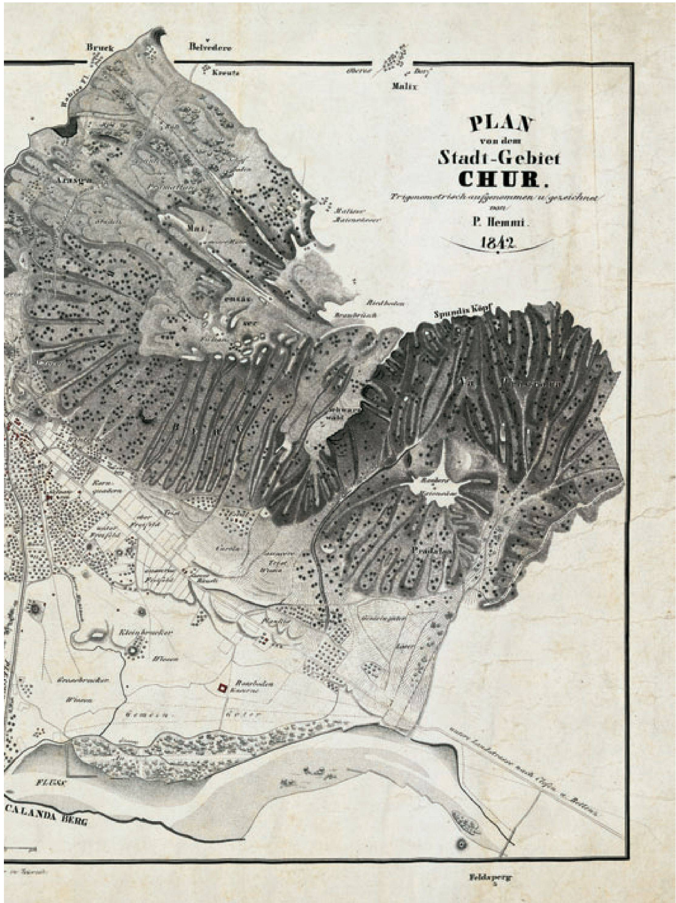
Abb. 2: Plan von dem Stadt-Gebiet Chur. Trigonometrisch aufgenommen u. gezeichnet von P. Hemmi im Massstab 1: 20 000. Format: 40,1 x 25,8 cm, Lithographie, südwestorientiert (StadtAC E 0222.001).