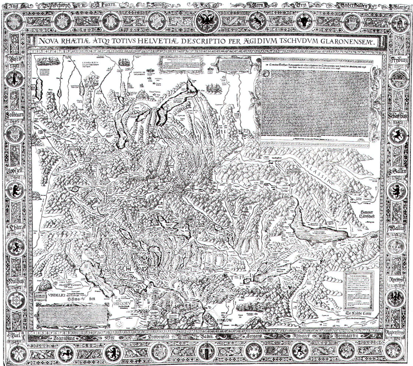
Abb. 2: Aegidius Tschudi: Nova Rhaetiae atque totius Helvetiae descriptio per Aegi- dium Tschudum Glaronensem. Basel, 1538; 2. Aufl. 1560. Südorientierte Holzschnitt- karte, Format: 111 x 87 cm, mit Wappenrahmen: 129 x 114 cm. Massstab ca. 1: 350 000.

hinein bestimmt hat und der er die im 18. Jahrhundert aufgekommene Bezeichnung «Vater der Schweizergeschichte» verdankt.