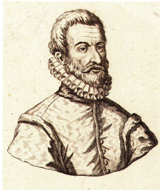
Abb. 1: Porträt von Aegidius Tschudi (1505–1572), aus: Johannes Müller, Merckwürdige Überbleibsel von Alterthümmeren an verschiedenen Orthen der Eydgenosschafft nach Originalien gezeichnet , 8. Theil. Zürich, 1777.

Aegidius Tschudi (1505–1572) stammte aus einem der führenden Geschlechter des Landes Glarus (Abb. 1). 2 In der Lateinschule bei Huldrych Zwingli, damals Pfarrer in Glarus, begegnete er schon früh dem neuen Geist des Humanismus. Einen Aufenthalt im Studentenhaus seines Landsmanns und Verwandten Heinrich Loriti, genannt Glarean, in Basel musste er 1517 nach nur einem Jahr abbrechen. Aber auch ohne Universitätsbesuch waren seine Interessen und seine Arbeitsmethoden von Anfang an zutiefst humanistisch geprägt mit der Hinwendung zur (römischen) Antike als Leitkultur, mit der Erforschung des eigenen Landes, mit dem Beherzigen der Aufforderung «ad fontes!» [Zurück zu den Quellen!]. Seine aus wissenschaftlichem Forscherdrang unternommenen Reisen, der über die konfessionellen Grenzen hinweg gepflegte freundschaftliche Austausch mit Gelehrten am Oberrhein und vor allem in Zürich sowie sein unermüdliches autodidaktisches Schaffen befähigten ihn auf den verschiedensten Gebieten zu eigentlichen Spitzenleistungen für seine Zeit, insbesondere in der Geschichtsschreibung, der Epigraphik, der Numisma-