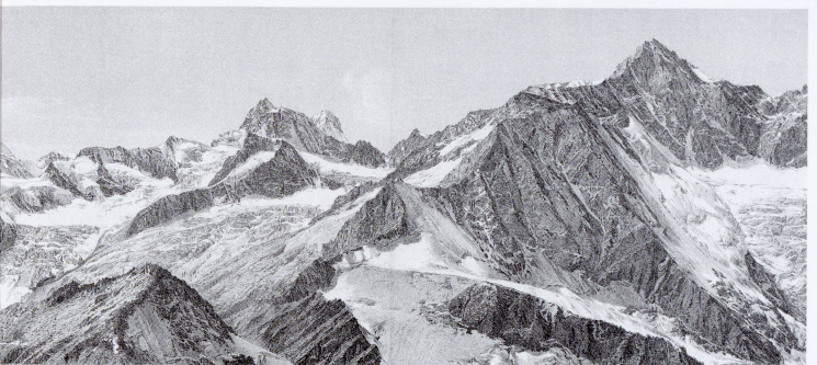
Ausschnitt aus einem Panorama von Xaver Imfeld, (publiziert im SAC Jahrbuch Bd. XXVII (1891). Abbildung auf ca. 50 % verkleinert.

Unter den richtigen Antworten werden zwei Blätter der faksimilierten Karte La Chaîne du Mont-Blanc , 1:50'000 die 1896 ebenfalls von Xaver Imfeld gezeichnet wurde, verlost. Falls Sie, liebe Leserinnen und Leser, selber eine Idee zu einer interessanten Quizfrage haben, so scheuen Sie sich nicht, uns diese mitzuteilen. Wir honorieren selbstverständlich auch jede publizierte Frage.