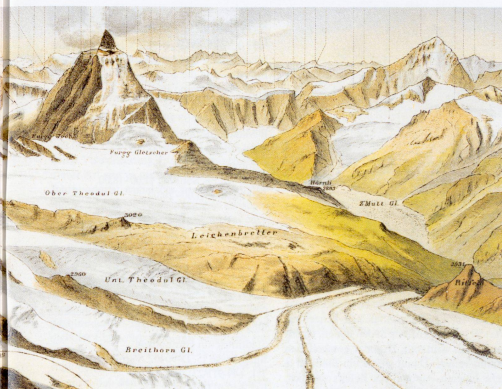
Ausschnitt aus dem Panorama von Monte Rosa von Xaver Imfeld, 1878. Mehrfarbiger Stein- druck. Abbildung aus dem Ausstellungskatalog Augenreisen – Das Panorama in der Schweiz .

Der internationalen, romantischen Alpenbegeisterung folgte im 19. Jahrhundert zunehmend die Verherrlichung der hehren Alpen als nationales Symbol der Schweiz, mit einem erklärenden Blick auf Heimat und Vaterland. Trotz der strengen Wissenschaftlichkeit, welche die damaligen Panoramazeichner beanspruchten, konnten sich deren Werke diesem kulturgeschichtlichen Einfluss kaum entziehen.