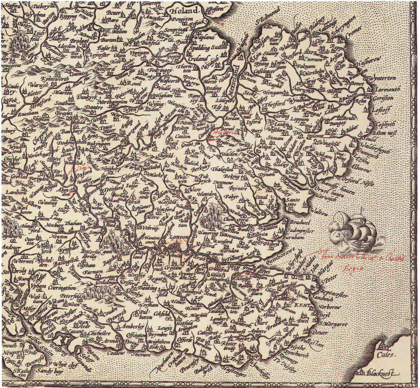
Abb. 8: Ausschnitt aus der England-Karte mit handschriftlichen Eintragungen.