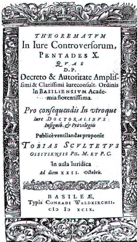
Abb. 4: Titelblatt der Dissertation (Basel 1597) von Tobias Scultetus (Bern, Schweizerische Landesbibliothek).

mete Kepler mit Datum vom 13. April 1612 seine Eclogae chronicae (erschienen 1615), eine Sammlung von Briefen über chronologische Probleme betreffend die Lebenszeit von Jesus Christus. 36 Der profane Hauptgrund dieser Widmung war vermutlich die Erinnerung, dass die schlesische Kammer unter Scultetus eine bereits 1610 ergangene Anweisung über 2000 Taler Gehaltsrückstände an Kepler endlich auszahlen möge. Hier ist allerdings nichts geschehen. Noch Ende 1614 musste der Mathematiker Benjamin Ursinus (Benjamin Behr, 1587–1633) 37 aus Beuthen Kepler brieflich raten, in dieser Angelegenheit zu einem persönlichen Gespräch nach Wien zu reisen, wo sich Scultetus gerade aufhalte. 38