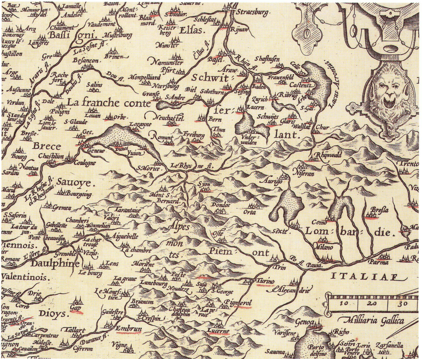
Abb. 10: Ausschnitt aus der Frankreich-Karte mit handschriftlichen Eintragungen.

In der Hennegau-Karte (Nr. 43) sind die Namen aller grösseren Städte unterstrichen. Die Bedeutung dieser Region in Gesamtkontext wird weiter deutlich in der Flandern-Karte (Nr. 45). Hier beschränken sich die Unterstreichungen auf eine Route von Montreuil über Hesdin, Bapaume und Crevecoeur in den Raum zwischen Sambre und Maas, wo zahlreiche Städte markiert sind. Die zahlreichen Ortsmarkierungen in der Italien-Gesamtkarte (Nr. 73) sind auf zwei Regionen konzentriert: