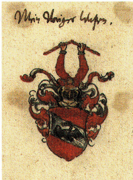
Abb. 5: Wappenbrief für Tobias Scultetus von 1608 (Wien, Österreichisches Staatsarchiv).

Das schriftstellerische Spätwerk von Scultetus ist derzeit noch schwer zu übersehen. 1603 erscheint er unter den Beiträgern der von Jan Gruter in Heidelberg publizierten Inscriptiones antiquae totius orbis Romani . 39 Um 1612 hat er eine staats- und finanzrechtliche Abhandlung Tractatum sive Discursus de fisco et fiscalibus verfasst. 40 Eine Anzahl seiner Gedichte ist (wieder) abgedruckt in dem Sammelband Delitiae poetarum Germanorum , den Gruter 1612 in Frankfurt am Main herausgegeben hat. 41 Weitere Epigramme finden sich u.a. als Hochzeitsgedichte, Beiträge zu Sammelwerken und unpubliziert in Stammbüchern. Wichtig war Scultetus auch als Patron anderer schlesischer Autoren, 42 er erscheint noch mehrfach als Adressat von Buchwidmungen. 1617 beschäftigte er den jungen Martin Opitz (1597–1639), den grossen deutschen