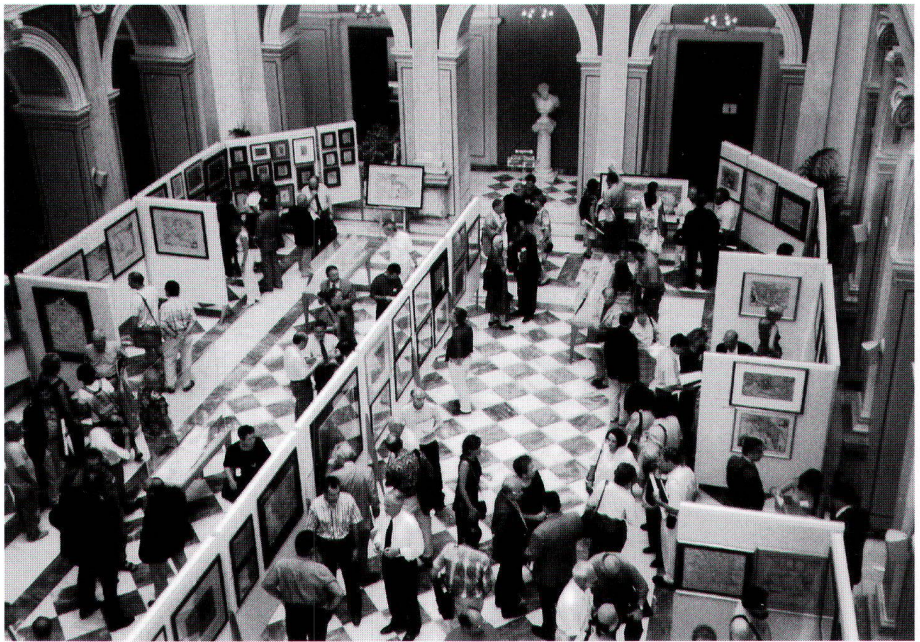
Ausstellung in der Melas Hall der Griechischen Nationalbank in Athen zum Thema «Kartographie des Mittelmeeres» (Photo: Marco van Egmond, Utrecht).

Schema von Vorträgen mit anschliessender Fragerunde wurde durch zwei so genannte Diskussionen am runden Tisch ergänzt und bereichert. Allerdings staunten viele Konferenzteilnehmende, dass vier Fachleute (ein Kunsthistoriker, ein Bibliothekar, eine Philosophin und ein Religionsphilosoph) je zwanzig Minuten über die ovale Weltkarte von Ortelius aus dem Jahre 1570 sprechen konnten, ohne im klassischen Sinn auf die kartographischen und geographischen Inhalte einzugehen. Überdies fand ein Workshop mit Peter Mesenburg und Robert Bremner über Portolankarten statt.