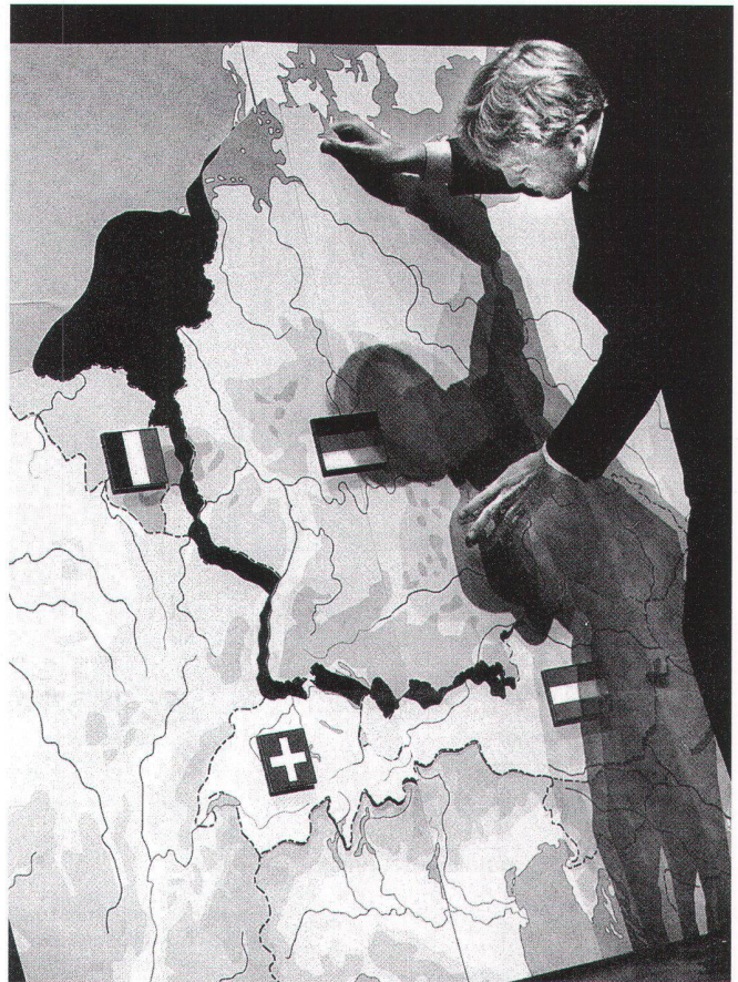
Kronprinz Willem-Alexander der Niederlande eröffnet den Kartographie-Kongress.

Der Arbeitskreis der Kartenkuratoren innerhalb der Deutschen Gesellschaft für Karto-