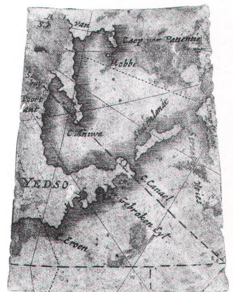
Abb. oben: Unter dem entfernten Gradfeld kam ein Seeungeheuer zum Vorschein (Abbildungen aus dem Katalog Erd- und Himmelsgloben , Mathematisch-Physikalischer Salon, Dresden).

Abb. rechts: Ausschnitt vom Erdglobus des Willem Janszoon Blaeu, um 1643. Durchmesser: 68 cm. Bei Restaurierungsarbeiten wurde ein aufgeklebtes Gradfeld entdeckt. Aus Kostengründen hatte der Verleger damals offensichtlich nicht das ganze Segment stechen lassen, sondern nur ein Gradfeld (170° bis 180° E von Fuerteventura, 40° bis 50° N), das die neuentdeckte Nordküste der Insel Hokkaido (Yedso) zeigen soll.