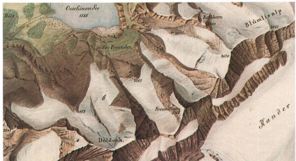
Partie des Berner Oberlandes 1:50 000, Originalzeichnung von Johann Rudolf Stengel, 1850.