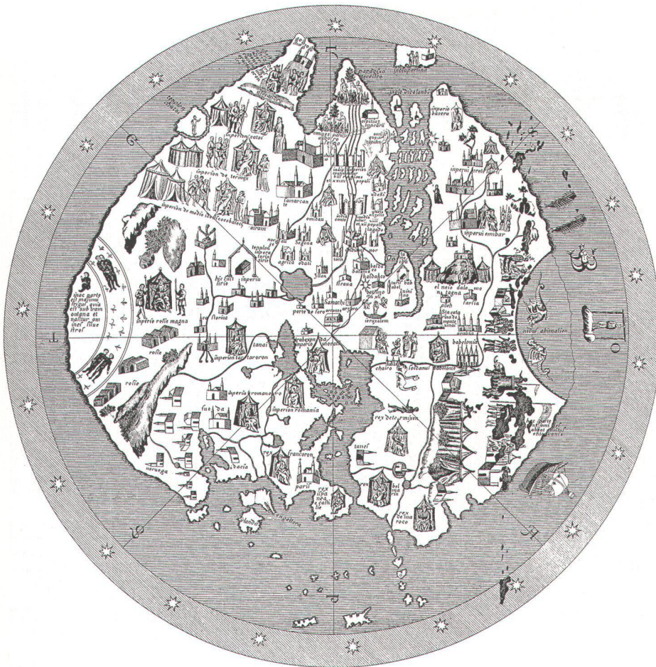
Abb. 2. Das Weltbild des Andrea Bianco, 1436. Seine Planisphäre zeigt im Südatlantik, in Küstennähe, ein Schiff, um anzudeuten, dass Bianco der Meinung ist, Afrika könne umsegelt werden. Diese Vorstellung vertrat Fra Mauro später ebenfalls. Osten ist in der Karte oben. (Nach Santarem: Atlas composé de mappemondes. Paris 1849).