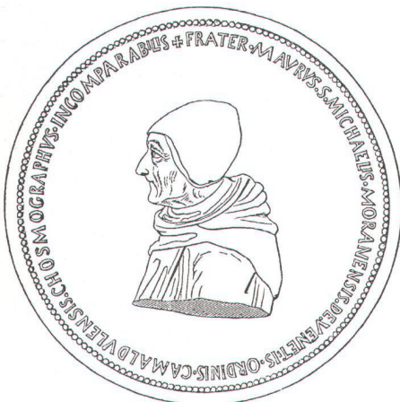
Abb. 3. Die von der Republik Venedig zu Ehren des Kamaldulensermönchs Fra Mauro geprägte Medaille.