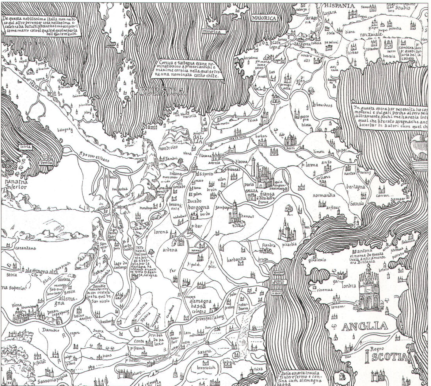
Abb. 5. Das Gebiet der heutigen Schweiz und die angrenzenden Regionen. Etwas verkleinerter Ausschnitt aus der Fra Mauro-Weltkarte von ca. 1460. Lineare Umzeichnung der Kopie in der Biblioteca Nazionale Marciana, Venedig. (Faksimile-Atlas des Vicomte de Santarem, 1854).