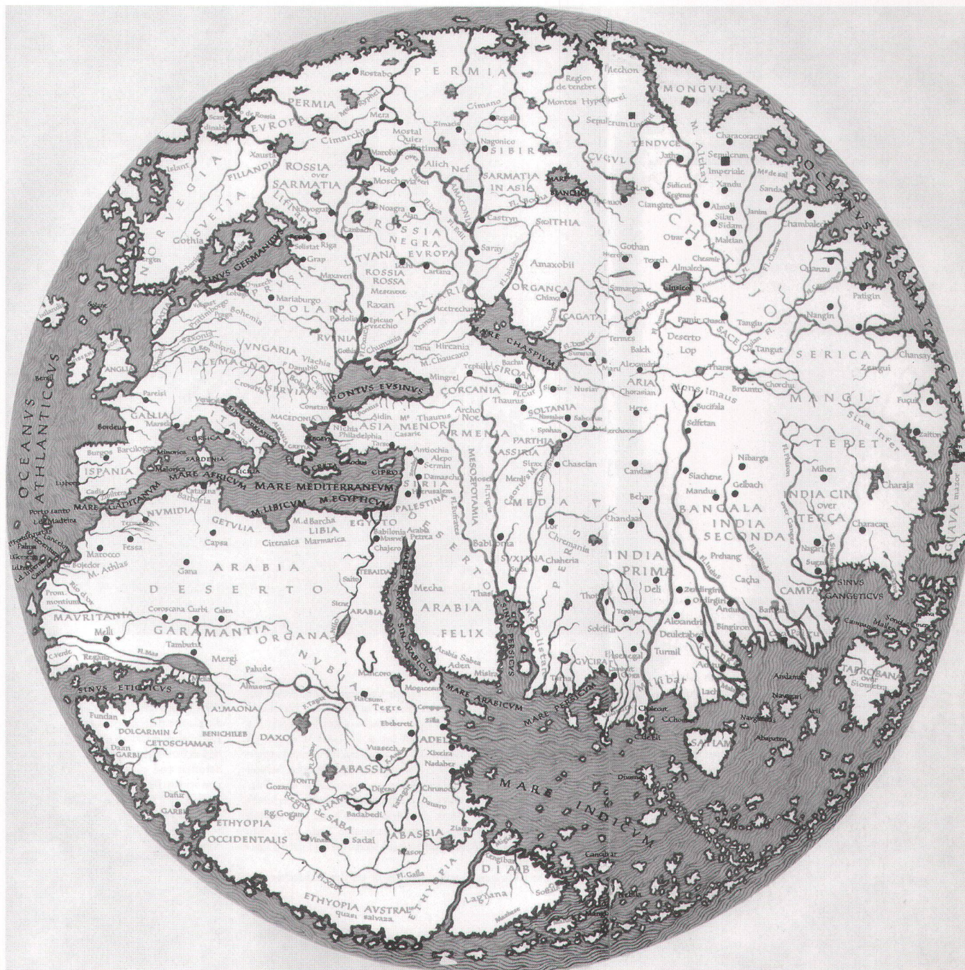
Abb. 1. Weltbild des Fra Mauro, Murano, Venedig, ca. 1460. Die Abbildung zeigt eine auf den linearen Inhalt reduzierte und in moderne Schrift transkribierte Umzeichnung der Kartenkopie von Andrea Bianco (?), Biblioteca Nazionale Marciana, Venedig. Durchmesser der Karte: ca. 195 cm. Die Abb. ist gegenüber der Originalkarte, in welcher Süden oben ist, um 180° gedreht.