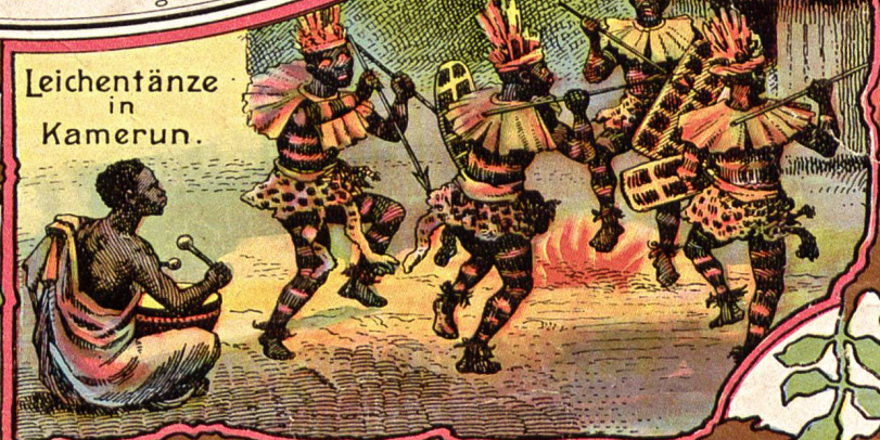
Leichtentänze in Kamerun.