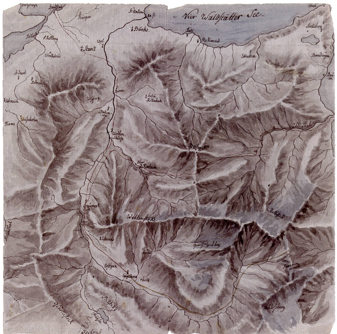
Abb. 70: Manuskriptkarte Nidwalden und Engelberg von Hans Conrad Escher, um 1800. Massstab 1:120 000, Format: 19x19 cm (ZBZ, MK HCE 26).

Den Weg nach Engelberg hätte Escher bestimmt auch ohne Karte gefunden. Wieso hat er sich trotzdem die Mühe genommen, dieses sorgfältig gezeichnete Kärtchen anzufertigen? Weshalb hat er insbesondere die Gebirgszüge so relief-scharf dargestellt? Wir wissen es nicht. Eine Vermutung geht dahin, dass er sich die Nidwaldner Gebirgslandschaft einprägen wollte, um dann mit dem fokussierenden Auge des Geologen durch das Gebiet zu wandern.