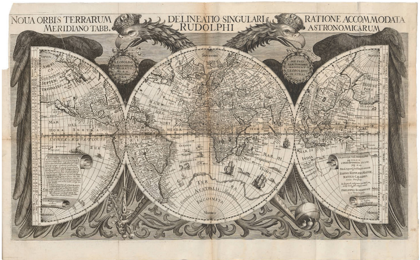
Abb. 4: Die abschliessende Fassung der Weltkarte zu den Tabulae Rudolphinae (1658), Format: 68 x 38,5 cm (ETH-Bibliothek Zürich, RAR 8895).

halb der Inhalt vor allem auf die Küsteneinträge konzentriert werden solle. 14