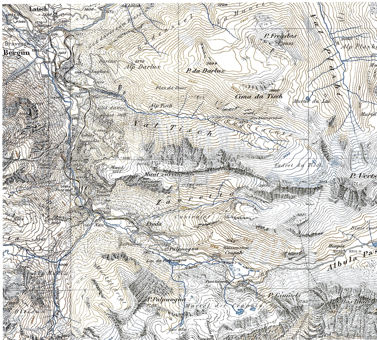
Abb.3: Ausschnitt aus der Siegfriedkarte 1:50 000, Blätter 426 Savognin und 427 Bever , Ausgabe 1902.