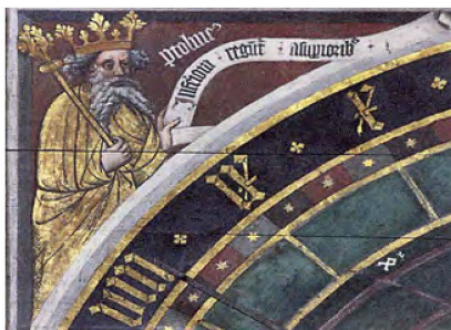
Ptolemaios als König mit Blattkrone und Szepter. Stralsund, Astronomische Uhr, 1594 (Ergänzungsband, S. 406).