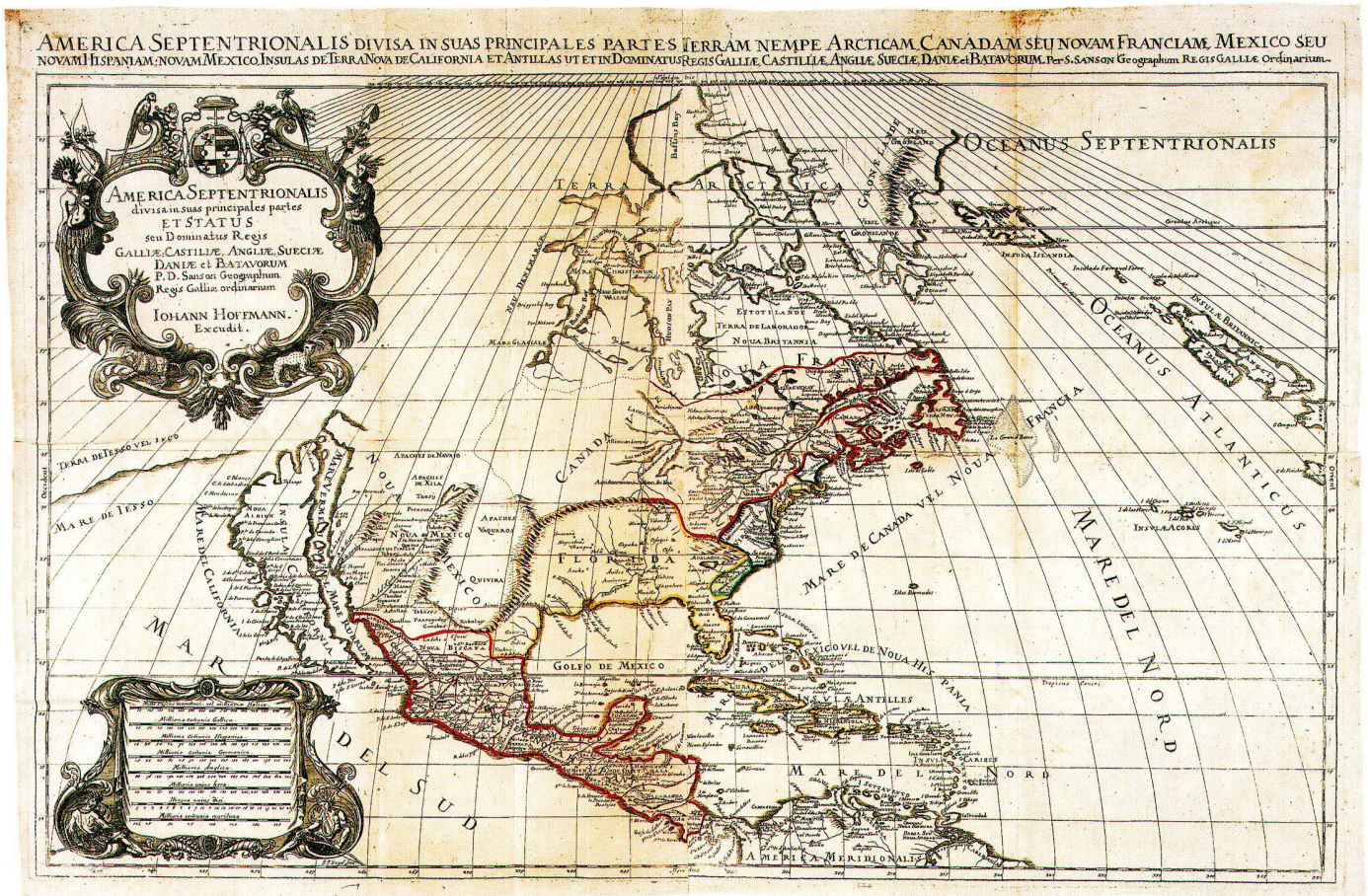
Abb. 3: Nordamerika (um 1685), 2 Blätter, 86 x 57 cm (UB Bern, ZB, Ryh 7801:8).