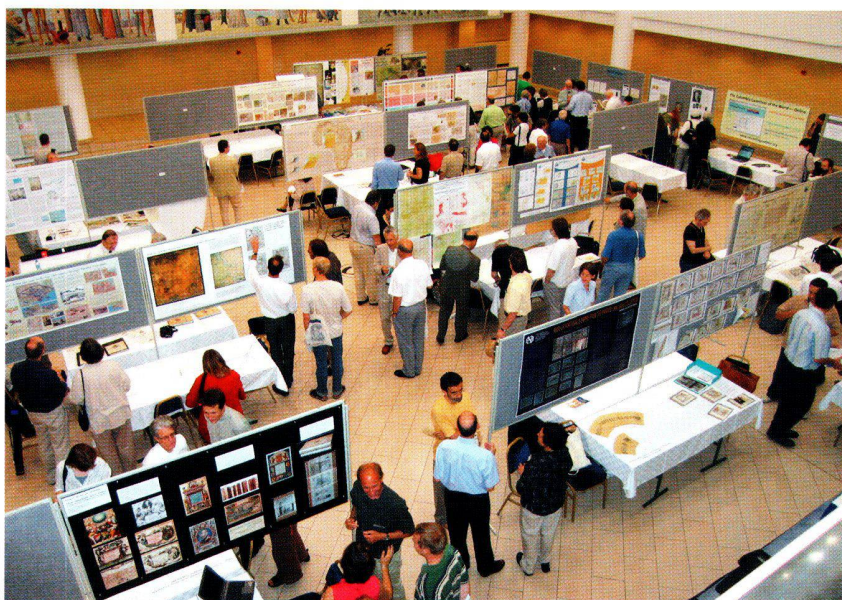
Teil der Posterausstellung der 21. Internationalen Konferenz zur Geschichte der Kartographie in Budapest.