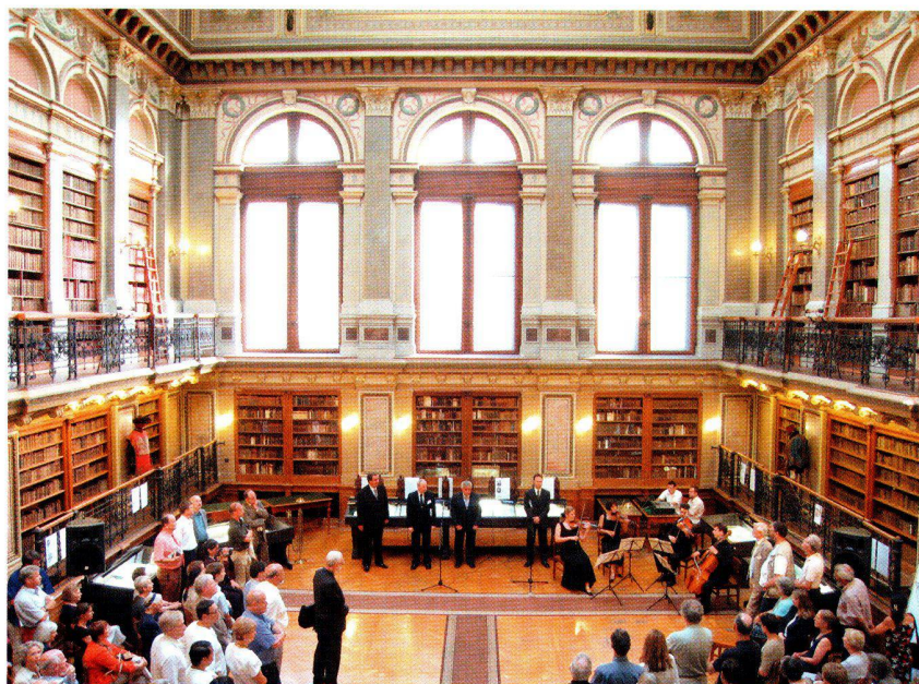
Musikalische Umrahmung zur Eröffnung der Kartenausstellung in der Eötvös Loránd Universitätsbibliothek in Budapest.