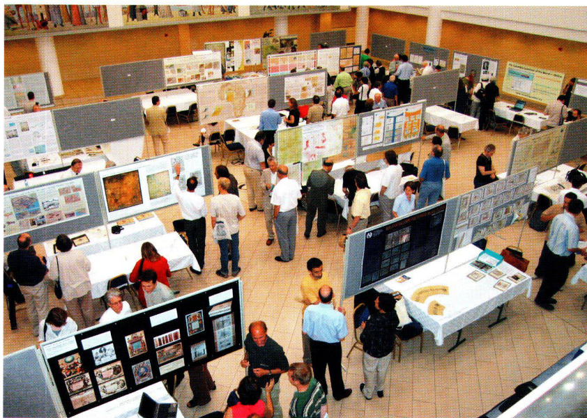
Teil der Posterausstellung der 21. Internationalen Konferenz zur Geschichte der Kartographie in Budapest.

Boundaries and Resource Rights: Cartography of US Appalachian Lumber, Coal & Mining Rights.