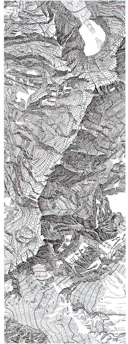
Die Engelhörner: Kopie des von Alfred Oberli erstellten Felsoriginals für die Landeskarte 1:25 000, Blatt 1230 Guttannen (Schichtgravur auf Glas). Abbildung auf 150% vergrößert.