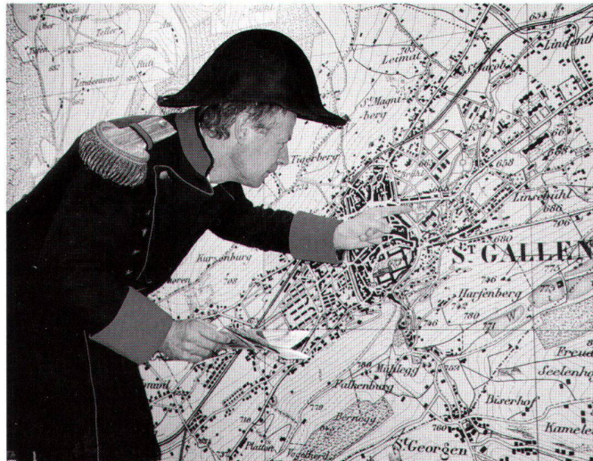
General Dufour alias Jean-Philippe Amstein, Stv. Direktor von swisstopo, stellte anlässlich der OLMA in St.Gallen den Medien die neue CD-ROM Dufour Map vor.

Die Dufour Map ist das erste interaktive Kartenwerk, das komplett intern bei swisstopo durch den Prozess «Interaktive Kartenanwendungen» hergestellt wurde. Auf vielfachen Kundenwunsch hin, insbesondere aus Schulkreisen, und auf Grund der Erfahrungen mit dem «Atlas der Schweiz-interaktiv» wird mit Dufour Map die Landeskarte neben Windows nun erstmals auch für den Macintosh (OS X und 9) angeboten.