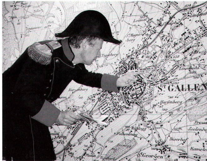
General Dufour alias Jean-Philippe Amstein, Stv. Direktor von swisstopo, stellte anlässlich der OLMA in St. Gallen den Medien die neue CD-ROM Dufour Map vor.

Die Dufour Map ist das erste interaktive Kartenwerk, das komplett intern bei swisstopo durch den Prozess «Interaktive Kartenanwendungen» hergestellt wurde. Auf vielfachen Kundenwunsch hin, insbesondere aus Schulkreisen, und auf Grund der Erfahrungen mit dem «Atlas der Schweiz-interaktiv» wird mit Dufour Map die Landeskarte neben Windows nun erstmals auch für den Macintosh (OS X und 9) angeboten.