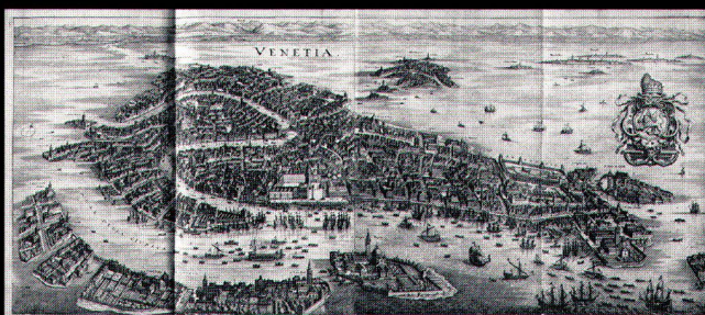
M. Merian, Itinerarium Italiae nov-antiquae . Frankfurt/Main 1640. Erlös November-Auktion 2002: € 8.200,-

Auf Wunsch übersenden wir Ihnen gern unsere illustrierten Kataloge.