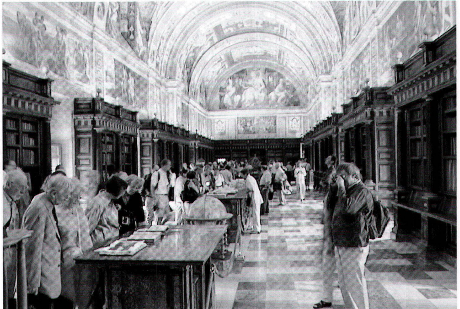
Ausstellung in der Bibliothek des Klosters von San Lorenzo de El Escorial.