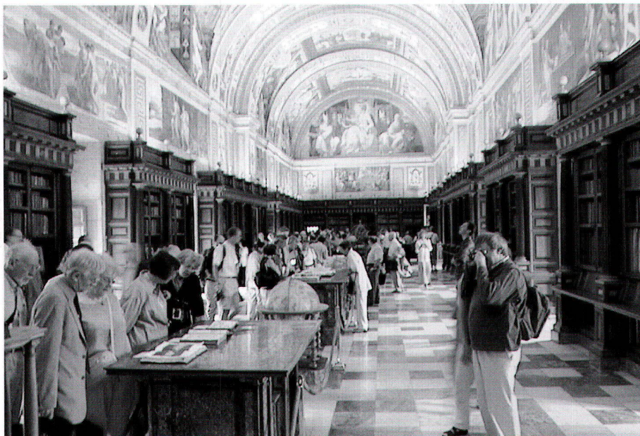
Ausstellung in der Bibliothek des Klosters von San Lorenzo de El Escorial.

Als Novum zeigte der Sicherheitschef der dänischen Nationalbibliothek, Jesper Düring Jørgensen, einen Zusammenschnitt aus automatischen Videoaufzeichnungen, die einen Kartendieb in flagranti dokumentieren. Die dazu abgegebenen Kommentare aus Insidersicht sind – zusammen mit den systematischen Analysen des ISCHEM-Leiters Robert Karrow – von grundlegendem Nutzen für jede Kartenbibliothek. Wie sich in der rege benutzten Diskussion herausstellte, fehlt es noch weitherum am Bewusstsein, dass eine sofortige und weltweite Information über gestohlene Karten von