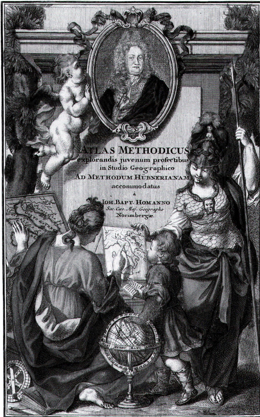
Abb. 3: Titelblatt des ersten methodischen Atlas von Johann Baptist Homann und Johannes Hübner, 1719. Unter dem Namen von Homann ist dessen kaiserlicher Geographentitel hinzugefügt. Auf dem Porträt ist Johannes Hübner abgebildet.

Allerdurchleuchtigst-großmächtigst- und unüberwindlichster Römischer Kaiser, auch in Hispanien, zu Hungarn und Böheim König etc. etc.