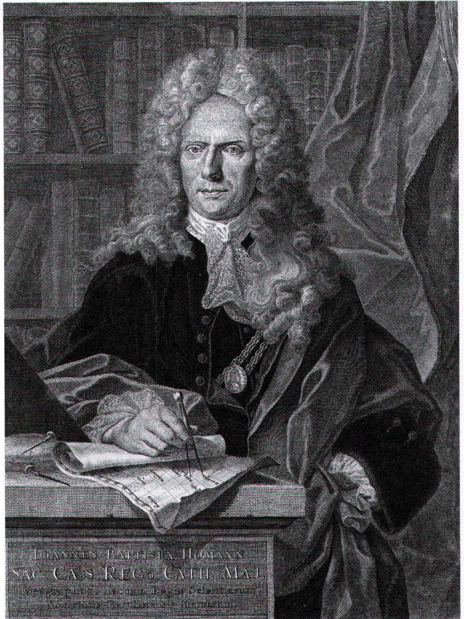
Abb. 1: Johann Baptist Homann (1664–1724). Der Stich von Johann Wilhelm Winter zeigt Homann mit der goldenen Ehrenkette Karls VI.

Nur für einen verschwindend geringen Bruchteil (vielleicht etwa 1%) der im deutschen Sprachraum erscheinenden Neu- oder Erstauflagen wurde allerdings um ein privilegium impressorium angesucht. Es war dies also kein Kontrollmechanismus. Als Kontrollorgan fungierte vielmehr – abgesehen von der obligatorischen Vorzensur in den einzelnen Territorien des Reichs – die in der 2. Hälfte des 16. Jahrhunderts gegründete, dem Reichshofrat untergeordnete kaiserli-