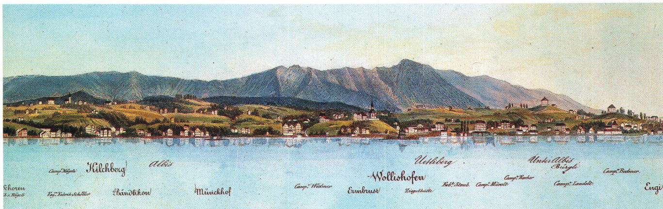
Abb. 3: Teilstück des Panoramas Ufer des Zürcher See's , 1838, von Franz Schmid (1796–1851). Ober- und Unterdorf Wollishofen liegen auf einer Verflachung hinter der Kirche, rechts der Kirche ist das Schulhaus. Unten am See standen die Häuser Erdbrust, Am Bach (heute Albisstrasse) und Haumesser. Der Bahnhof Wollishofen und die heutige

Seestrasse befinden sich in der ehemaligen Seewies, vor den Häusern Haumesser, zum Teil auf Aufschüttungen. Die Ansicht zeigt ferner Landgüter, eine Fabrik und die Ziegelei, die nach 1788 entstanden sind. Abbildung auf ca. 120% vergrössert (vgl. Abb. 8).