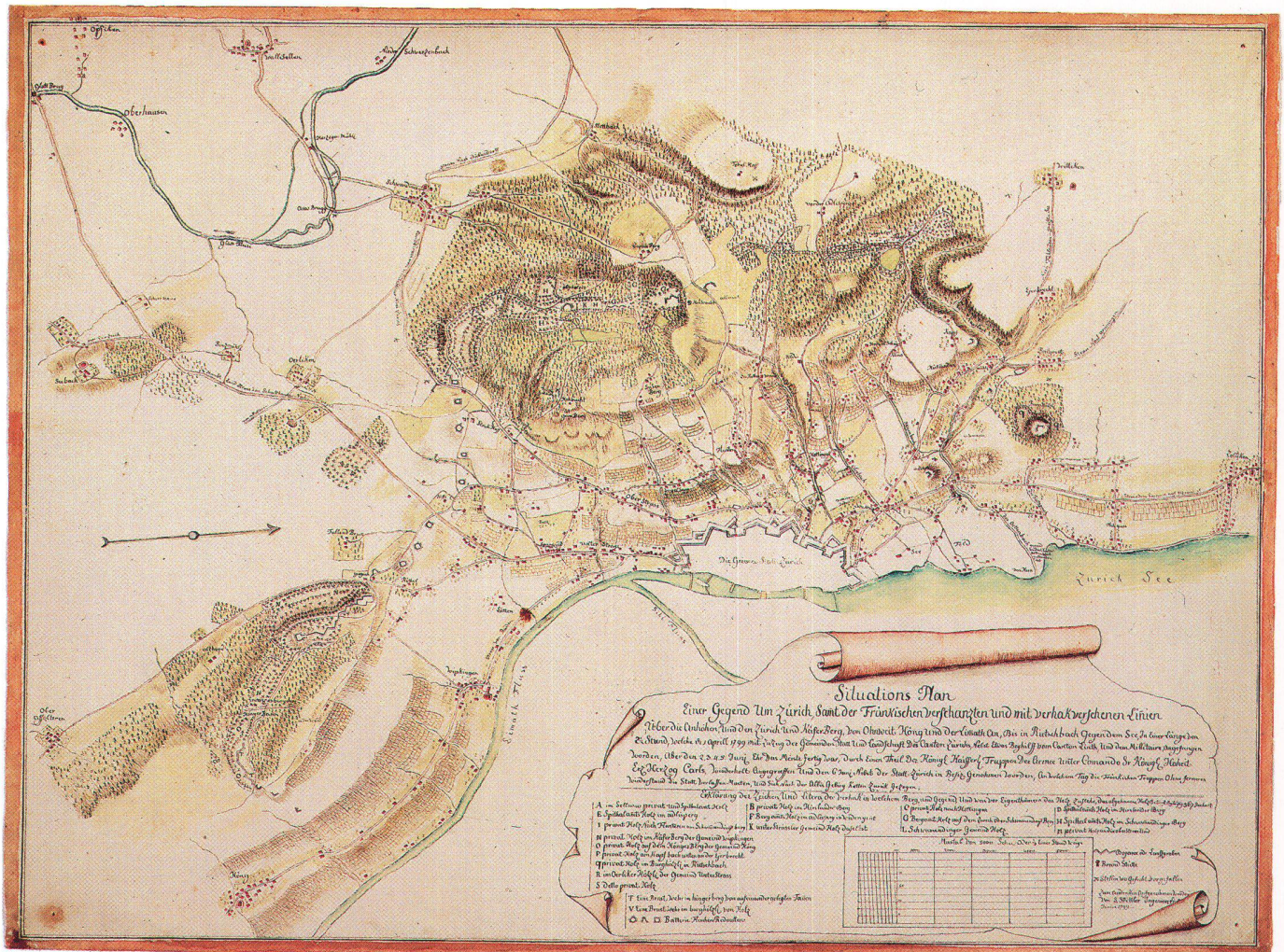
Abb. 6: Situations Plan einer Gegend um Zürich, samt der fränkischen verschanzten und mit verhakversehenen Linien von Sigmund Spitteler, 1799. Format 68,3 x 51,0 cm (ZBZ, Kartensammlung).