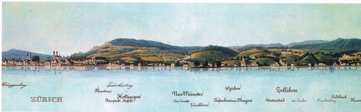
Abb. 8: Teilstück des Panoramas Ufer des Zürcher See's , 1838 von Franz Schmid (1796–1851). Auf dem Hügel des Burghölzli wächst wieder Wald. Auf der Stadtseite ist die Rodung durch die französischen Truppen am geringen Wuchs noch sichtbar. Davor, an Stelle der Franzosenschanze, erhebt sich auf dem kleinen Moränenhügel die neue Kirche

von Riesbach, die 1839 eingeweiht wurde. Schmid sah offensichtlich erst den Bauplatz, denn statt des Neumünsters im klassizistischen Stil zeichnete er eine Kirche in herkömmlicher Bauart. Abbildung auf ca. 120 % vergrössert (ZBZ, Kartensammlung) (vgl. Abb. 3).