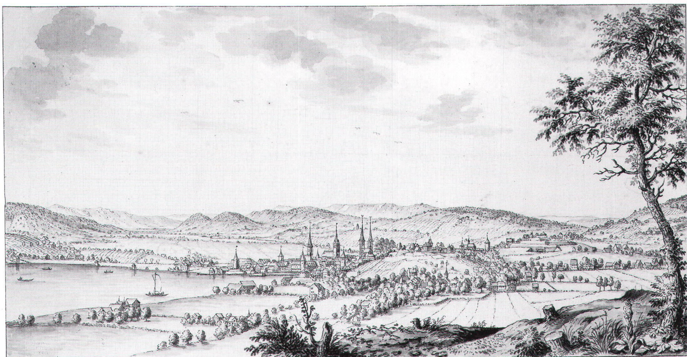
Abb. 4: Zürich von Riesbach her gezeichnet, vermutlich von Johann Melchior Füssli (1677–1736). Vorn, inmitten von Obstbäumen die erste Kirche von Riesbach am Kreuzplatz, dahinter der Hügel der Hohen Promenade. Rechts der Sattel des Milchbucks zwischen Geissberg (Zürichberg) und Hönggerberg (Chäferberg), das Einfallstor von Norden, wo die Franzosen die grossen Erdbefestigungen anlegten. Ganz

Seestrasse befinden sich in der ehemaligen Seewies, vor den Häusern Haumesser, zum Teil auf Aufschüttungen. Die Ansicht zeigt ferner Landgüter, eine Fabrik und die Ziegelei, die nach 1788 entstanden sind. Abbildung auf ca. 120% vergrössert (vgl. Abb. 8).