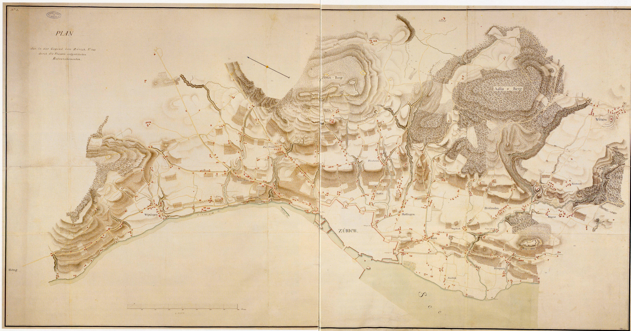
Abb. 5: Plan der in der Gegend von Zürich Anno 1799 durch die Franken aufgeführten Retranchementen von Franz Anton Messmer. Format 140 x 70 cm (ZBZ, Kartensammlung).

nicht hinlänglich Futter vor, auch wenn wir dem Militär kein Futter ausgeben müssten, wie wir leider täglich im Fall sind.