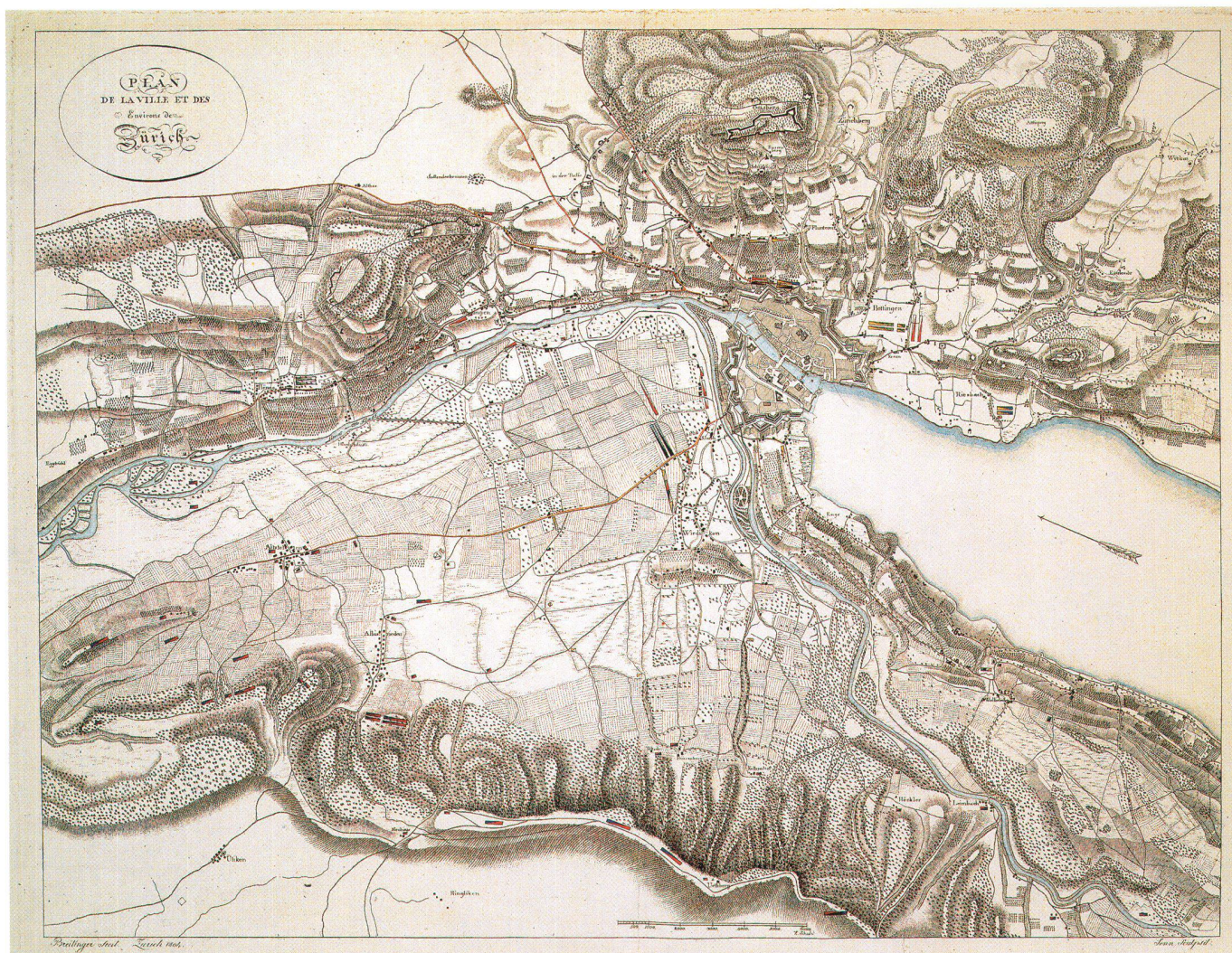
Abb. 9: Plan de la ville et des Environs de Zürich, Kupferstich von David Breitingen, 1804. Format 66,2 x 51 cm (StAZ).

aufgenommen (Abb. 6). Die Handzeichnung zeigt das Gebiet rechts der Limmat von der Gemeinde Höngg bis nach Riesbach und die anschliessenden Höhenzüge. Sie misst 68,3 x 51,0 cm. Der Massstab von ca. 1 : 14 500 ermöglichte es, auch die entfernteren Orte einzuzichnen, bei denen Gefechte stattfanden oder Befestigungen angelegt waren.