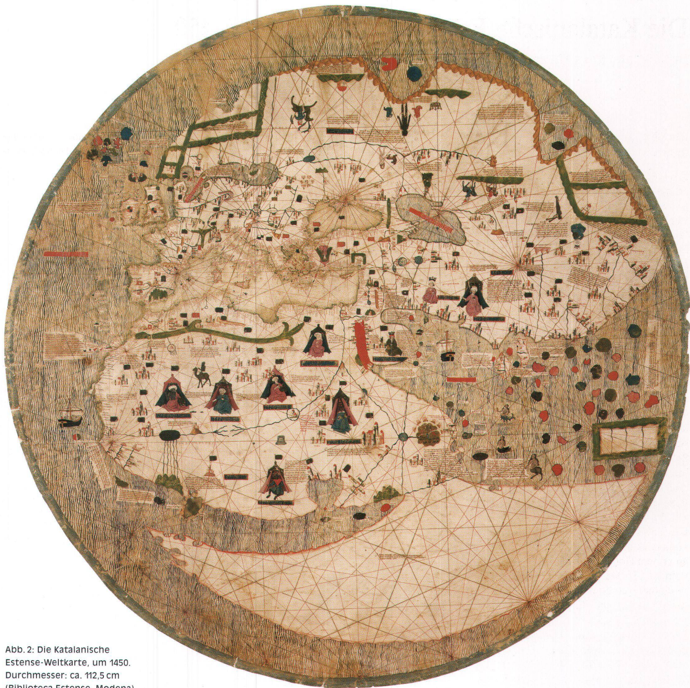
Abb. 2: Die Katalanische Estense-Weltkarte, um 1450. Durchmesser: ca. 112,5 cm (Biblioteca Estense, Modena).

Die ganze Karte stellt die klassische dreigeteilte Erde dar und ist – nach Art der Portolane – mit einem Rumbennetz von 16 Windstrichen überzogen, die von einer sechzehnstrahligen Windrose ausgehen, welche allerdings nicht im Zentrum der Karte steht, sondern etwa 15 cm nach Süden verschoben ist.