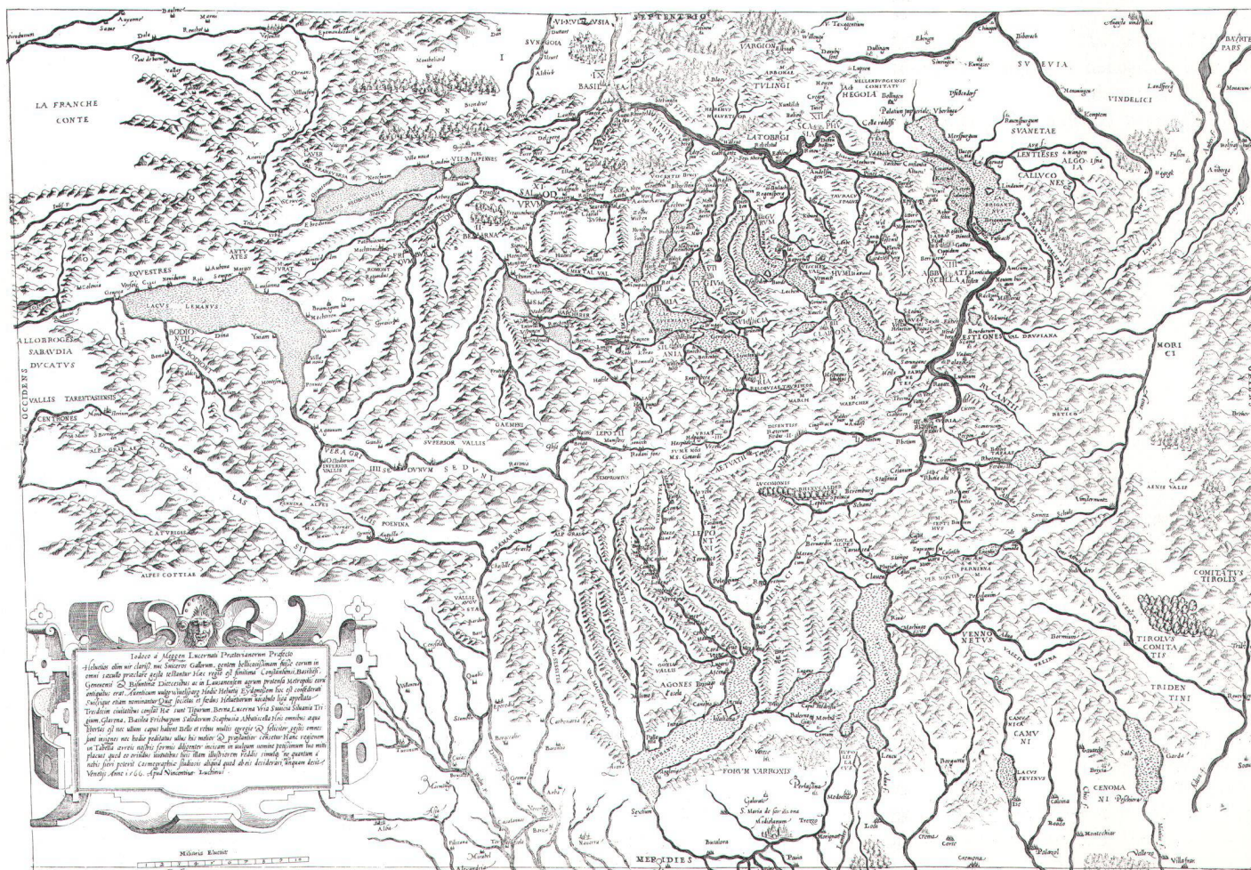
Ausgabe von Luchino, 1566. Format 57 x 40 cm. Vincenzo Luchino war von 1544 bis 1568 ein bedeutender Verleger von geographischen Karten, in Rom und zeitweise auch in Venedig tätig.

Das deutschsprachige Heft im Format A4, 16 Seiten mit 7 einfarbigen Abbildungen und 1 Diagramm kostet sFr. 15.- (inkl. Versandkosten Schweiz). Bezugsquelle: Verlag CARTOGRAPHICA HELVETICA, Untere Längmatt 9, CH-3280 Murten