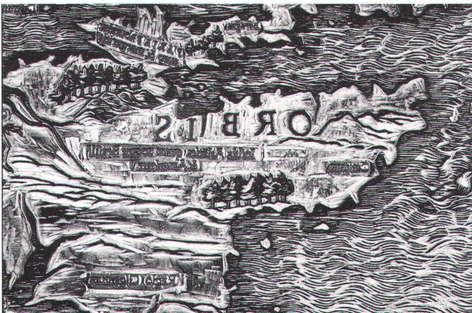
Abb. 2. Fertiger Druckstock mit den eingesetzten, aus Bleiletttern bestehenden Kartennamen.