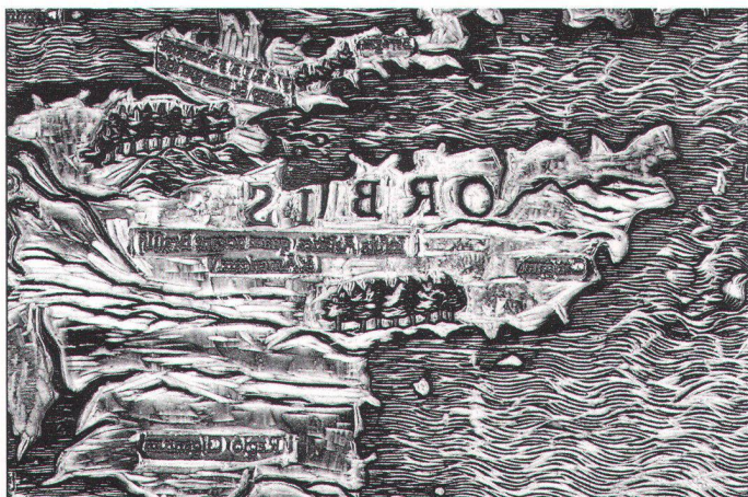
Abb. 2. Fertiger Druckstock mit den eingesetzten, aus Bleiletern bestehenden Kartennamen.