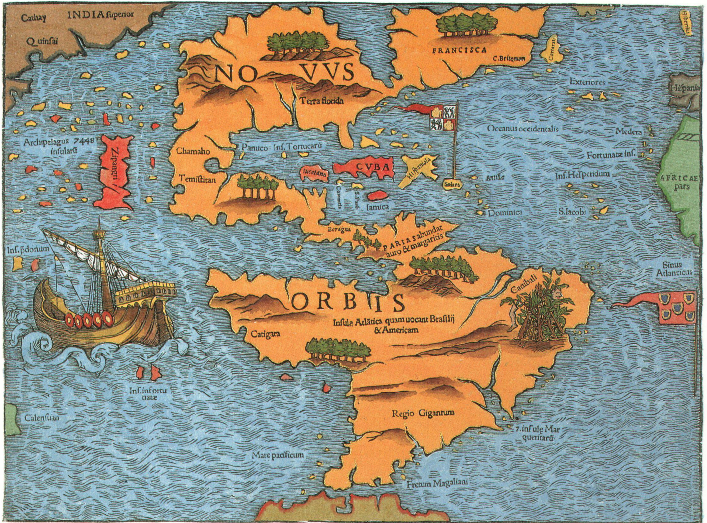
Abb. 4. Amerika-Karte von Sebastian Münster, aus «Geographia Universalis», Basel 1540 (Faksimile). Bildformat 35 x 26 cm.

(im Atelier von László Vincze) und die Druckfarbe speziell hergestellt. Das sehr markante Wasserzeichen «Cartart» soll verhindern, dass die neugedruckten Karten mit den Originalen verwechselt werden. Auf der Kartenrückseite wurde der lateinische Originaltext mit der entsprechenden Seitenzahl 45 ebenfalls im Hochdruckverfahren beigelegt (Abb. 3).