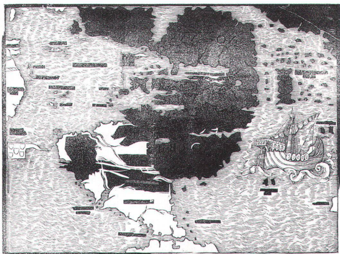
Abb. 1. Druckstock aus Kirschbaumholz mit begonnenem Schnitt der Karte. Die schwarzen Stellen zeigen das mittels Photoxylographie aufkopierte, seitenverkehrte Kartenbild.

Für den Druck der 500 Abzüge wurde nach verschiedenen Versuchen eine Zylinderpresse gewählt. Selbstverständlich wurden für diese Facsimilierung auch das hadernhaltige, alterungsbeständige Papier