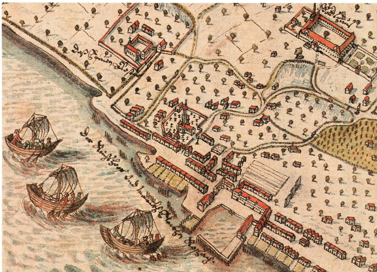
Ausschnitt: Blatt Rorschach