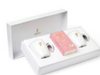
Il met l'eau à la bouche: le kit de thé de Sirocco