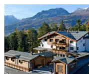
L'hôtel Sarain à Lantsch/Lenz