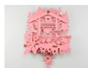
Un coucou suisse de SwissKoo