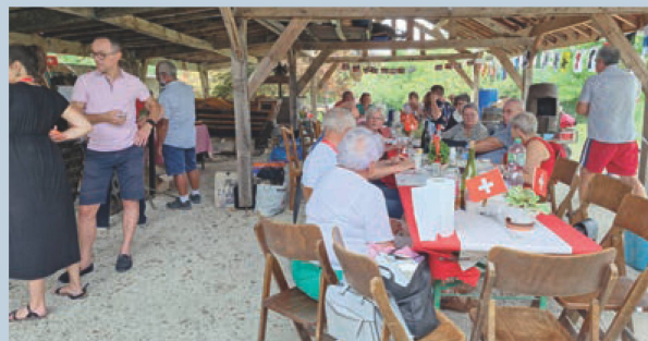
Cercle amical suisse de l'Aube

Immanquablement, les discours et les hymnes nationaux ont initié la journée. L'apéritif préparé par les membres du bureau était accompagné du vin suisse offert par le consul général. L'animation musicale était assurée par le groupe « Cors et Accords » de Cornimont. Une tombola a été organisée, comme toujours, et c'est à chaque fois un moment de surprises. Les participants sont unanimes pour trouver cette rencontre très conviviale. Nous laissons passer l'été et nous clôturons l'année 2024 par la rencontre automnale qui aura lieu le dimanche 24 novembre à l'Auberge Saint Bernard de Bettégney-Saint-Brice. Nous y dégusterons une bonne choucroute.