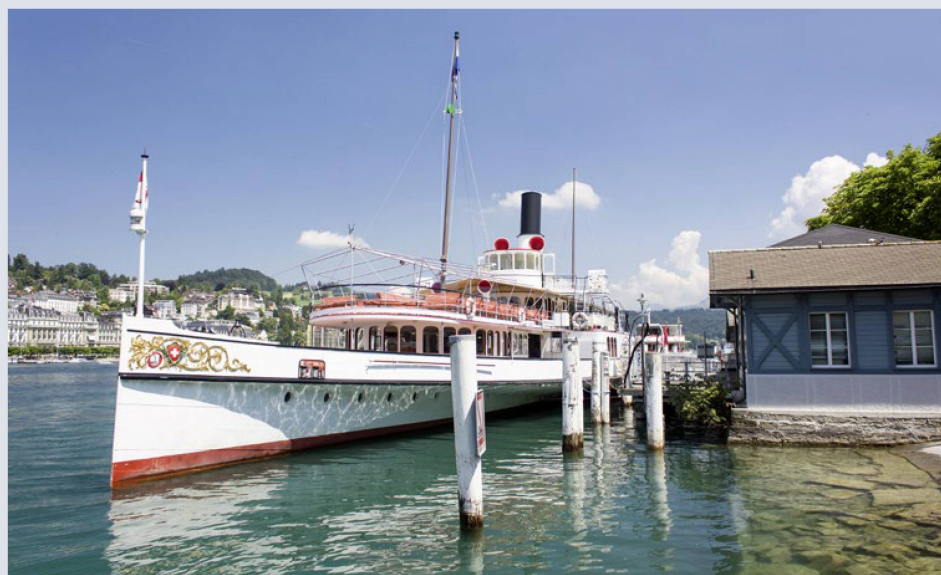
Les bateaux font partie du paysage à Lucerne: ici, le bateau à vapeur historique «Uri» au Bahnhofquai.

Ce congrès se caractérisera par la participation active de plus de 60 jeunes Suisses de l'étranger, issus des camps de vacances,