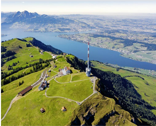
Prise de vue aérienne du Rigi avec vue sur le lac des Quatre-Cantons, le mont Pilate et le plateau lucernois.

et sera marqué par la présence d'un membre du gouvernement suisse et par la participation du monde économique et de la recherche, offrant ainsi de multiples occasions de réseautage. Les festivités comporteront des discours officiels, des animations et bien