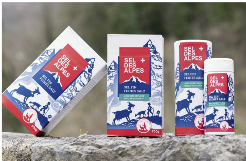
«Sel des Alpes»: le marketing du trésor blanc met aussi en évidence son origine.

Seulement 10% environ de l'or blanc vaudois est destiné à l'alimentation. Le reste est utilisé pour le salage des routes et à des fins industrielles. L'usine dispose d'ailleurs d'un entrepôt de stockage d'une capacité totale de 12'000 tonnes. Dans un hangar, le visiteur se retrouve face à une montagne de sel! N'est-ce pas