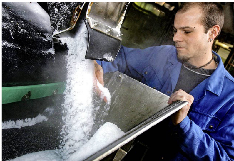
Après le processus de séchage, le sel encore chaud est examiné par un collaborateur de la saline.