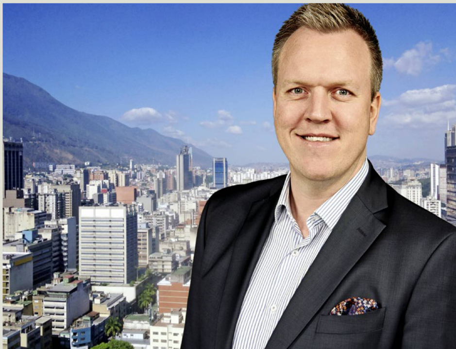
Titulaire d'un diplôme d'économiste d'assurance, Pascal Sollberger a travaillé dans le secteur privé des assurances et de la gestion des processus pendant plus de dix ans avant d'entrer au DFAE.

Photo DR, Pascal Sollberger, iStock (montage photo)