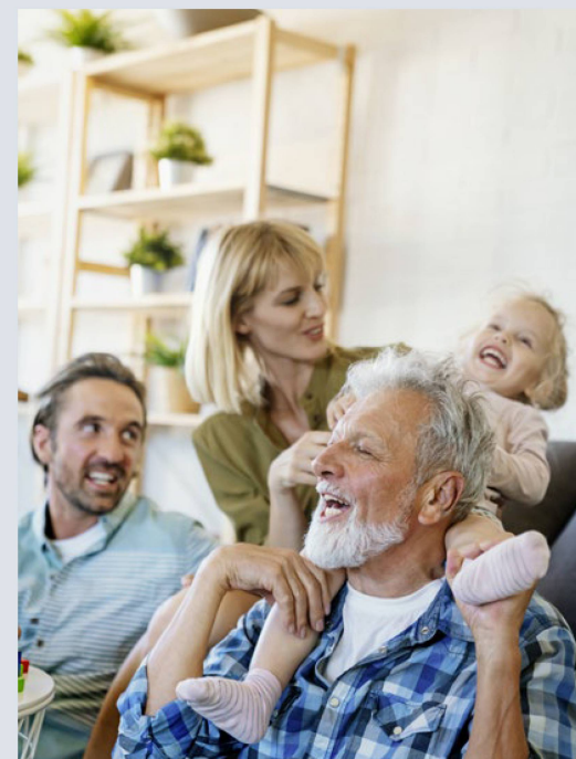
Régler sa succession de façon équitable n'est pas évident.