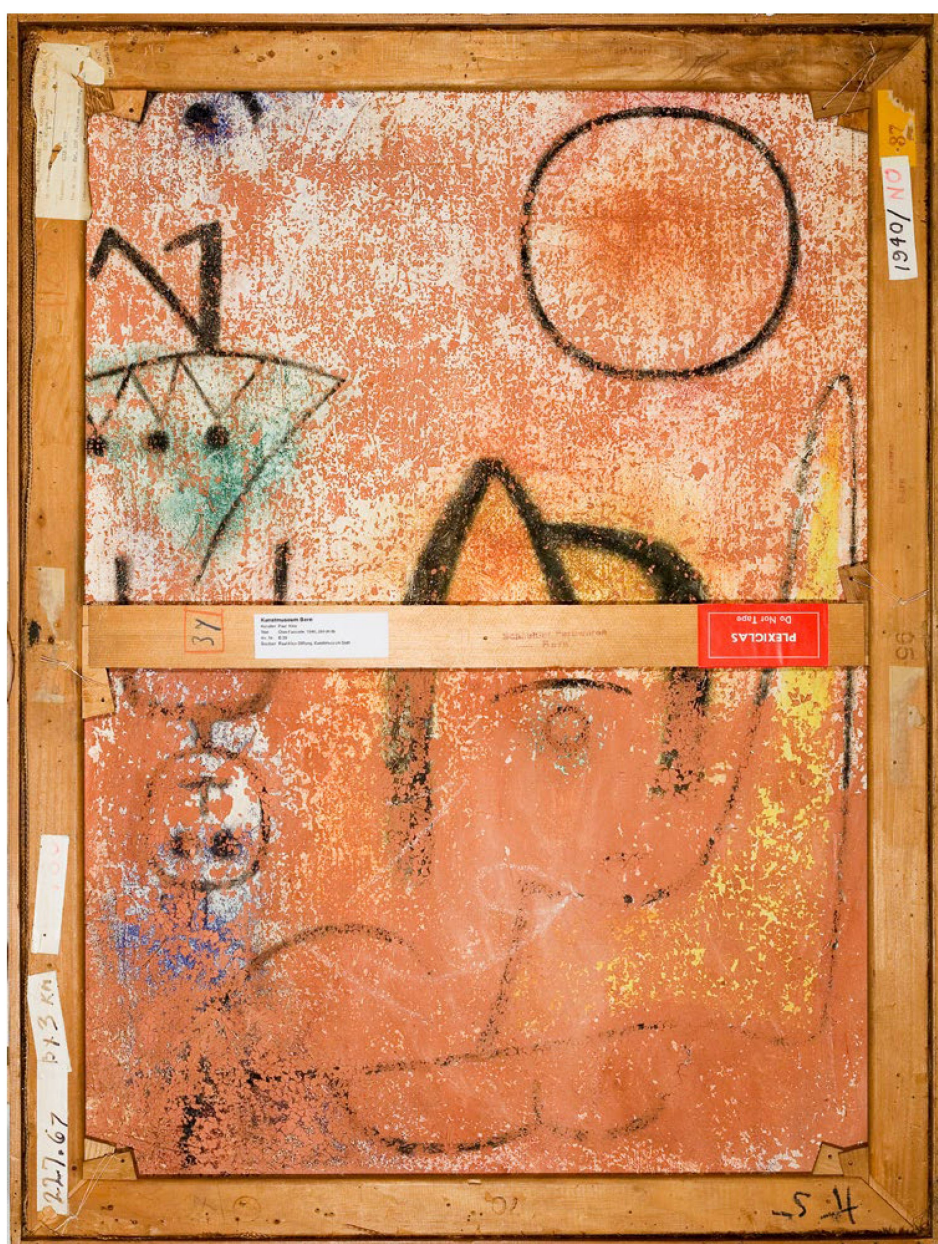
Verso de «Façade en verre»: «Fillette mourant et devenant», 1940, 288 71,3 x 95,7 cm Centre Paul Klee, Berne