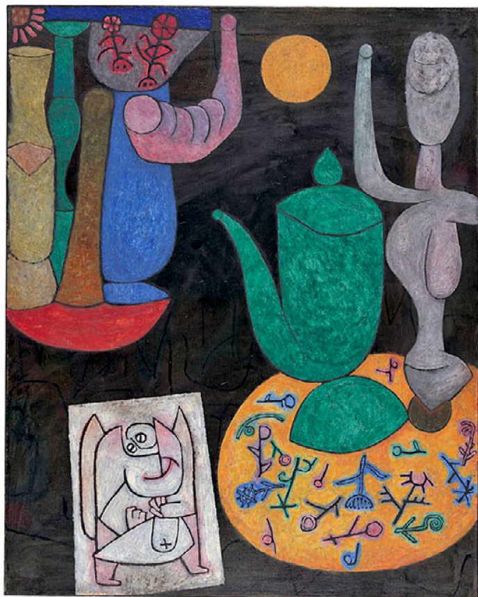
Paul Klee «Sans titre» (dernière nature morte), 1940 Huile sur toile 100 x 80,5 cm Centre Paul Klee, Berne, Donation de Livia Klee