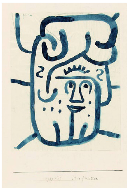
Paul Klee «Belle-mère», 1939, 497 Aquarelle et crayon sur papier sur carton 27 x 21,4 cm Centre Paul Klee, Berne Donation de Livia Klee