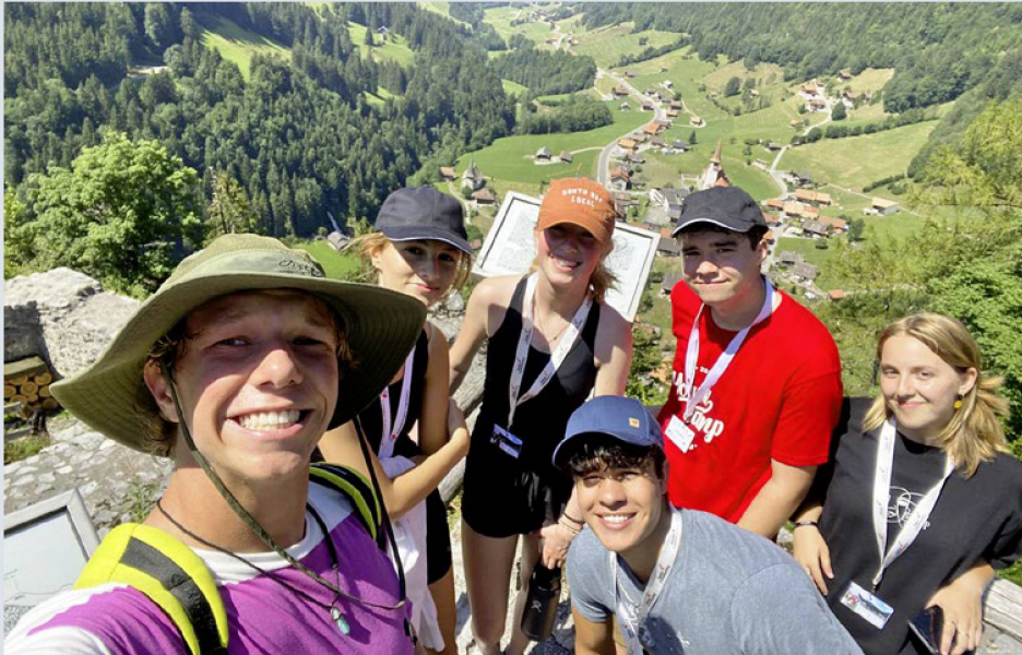
Après l'ascension, la vue est d'autant plus belle.

C'est la tête pleine de bons souvenirs des camps d'été de cette année qu'au Service des jeunes de l'Organisation des Suisses de l'étranger (OSE), nous préparons les offres pour l'année à venir. Nous pouvons d'ores et déjà vous annoncer que plusieurs camps de vacances d'été et d'hiver auront lieu en Suisse, tout comme le congrès en ligne, en collaboration avec le Parlement des Jeunes Suisses de l'étranger YPSA.