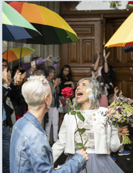
Le «mariage pour tous» n'a pas qu'un caractère symbolique: à maints égards, la situation des couples mariés est meilleure que celle des partenaires enregistrés.

Le partenariat enregistré peut être converti en mariage par une simple déclaration. Vous pouvez envoyer cette déclaration de conversion à la représentation suisse dont vous dépendez. Si vous le souhaitez, vous pouvez aussi demander une cérémonie assortie d'une procédure préparatoire au mariage. Cela vous offre l'avantage de pouvoir changer de nom au cours de la cé-