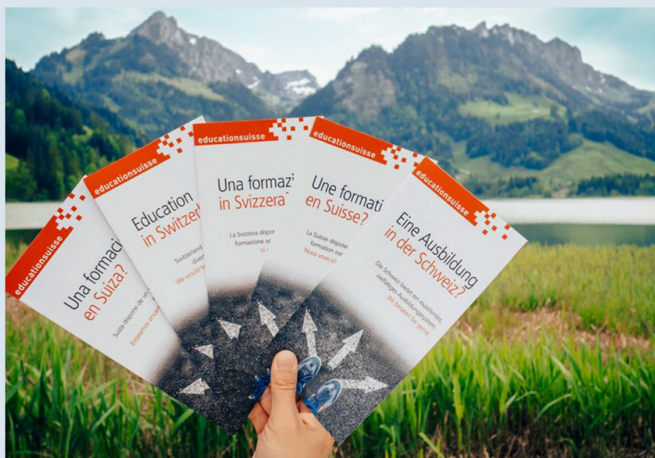
Des dossiers d'information sur la formation en Suisse sont disponibles dans de nombreuses langues.