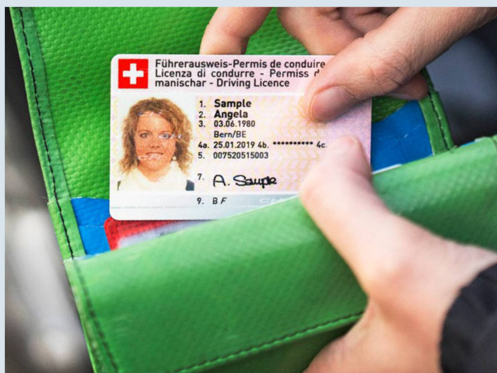
En Suisse, le permis de conduire n'existe plus qu'au format de carte de crédit.

Question: Je vis à l'étranger (hors de l'espace UE/AELE) depuis de nombreuses années et je viens d'apprendre que le permis de conduire suisse sur papier bleu ne sera plus valable après le 31 janvier 2024, et qu'il doit être remplacé par un permis au format de carte de crédit. Ni le consulat suisse, ni l'office de la circulation routière auxquels je me suis adressé en Suisse n'ont pu m'aider. Les Suisses de l'étranger doivent bien avoir une possibilité de ne pas perdre leur ancien permis de conduire suisse! Que dois-je faire?