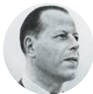
Emil G. Bührle (1890–1956): amateur d'art et fabricant d'armes.

Cela fait longtemps que l'incroyable histoire d'Emil G. Bührle fait l'objet d'une étude critique. L'Allemand avait été envoyé à Zurich en 1924 afin de développer sur sol neutre un canon de défense anti-aérienne pour la fabrique de machines-outils Oerlikon. Il ne pouvait pas le faire en Allemagne, car le traité de paix de Versailles interdisait aux Allemands de reconstituer leur industrie d'armement. Bührle fit rapidement de la fabrique Oerlikon, la plus grande productrice de matériel de guerre de Suisse, et devint lui-même la plus grande fortune du pays. Naturalisé