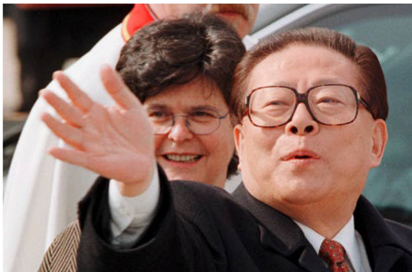
Jusque-là, tout va bien: le chef d'État chinois Jiang Zemin devant la présidente de la Confédération Ruth Dreifuss à son arrivée à l'aéroport de Genève en 1999.