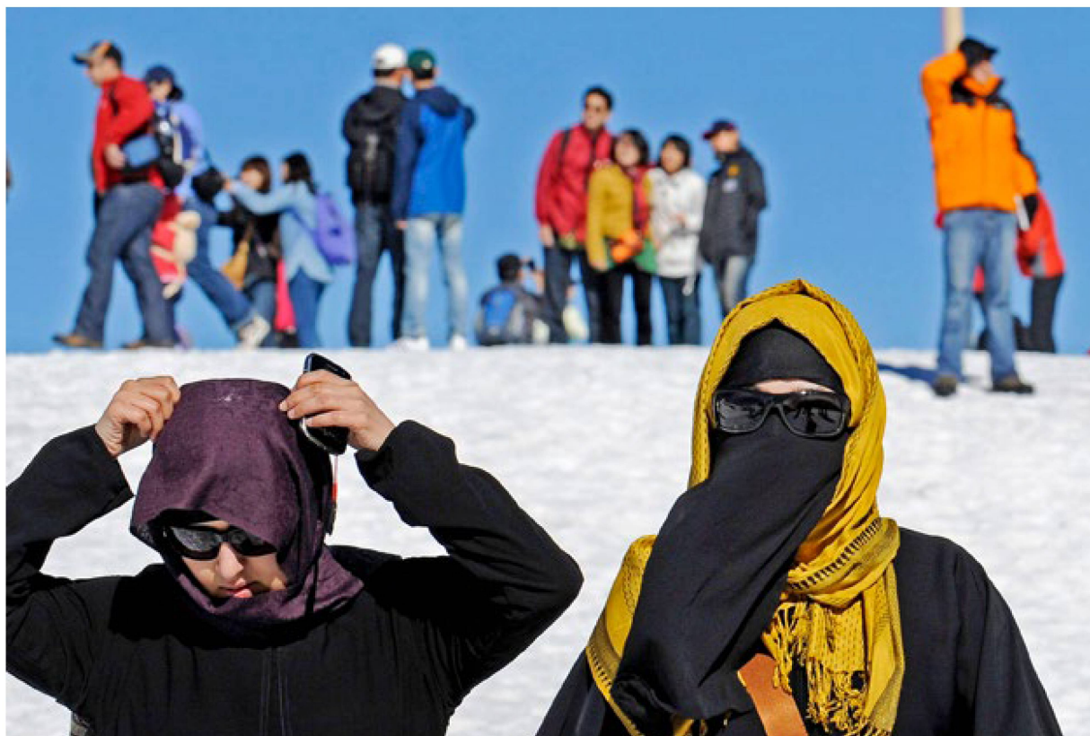
Même balayées par un vent glacial, comme ici au Jungfrauoch, les touristes ne pourront plus se couvrir intégralement le visage.