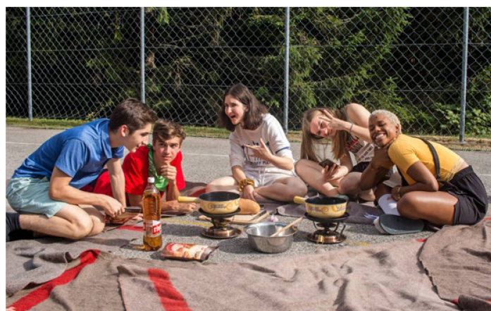
En 2019, encore sans masque et sans distanciation imposée, on se régala d'une fondue au camp de sport et loisirs de Sainte-Croix.

En raison de la situation sanitaire dans le monde (pandémie du coronavirus), l'Organisation des Suisses de l'étranger a pris la difficile décision de réduire le nombre de camps prévus initialement en 2021. Elle organisera uniquement deux camps, un dans les Alpes vaudoises, l'autre dans les Alpes valaisannes. Le camp d'été aura lieu du 10 au 23 juillet 2021 à Château-d'Oex et le camp d'hiver du 27 décembre 2021 au 5 janvier 2022 à Grächen. Bien entendu, l'Organisation des Suisses de l'étranger suit de très près l'évolution de la pandémie dans le monde. Tout changement impactant l'organisation des camps sera indiqué sur le site internet: www.SwissCommunity.org .