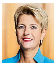
Karin Keller Sutter, ministre de la justice: les solutions purement étatiques ne sont pas optimales.