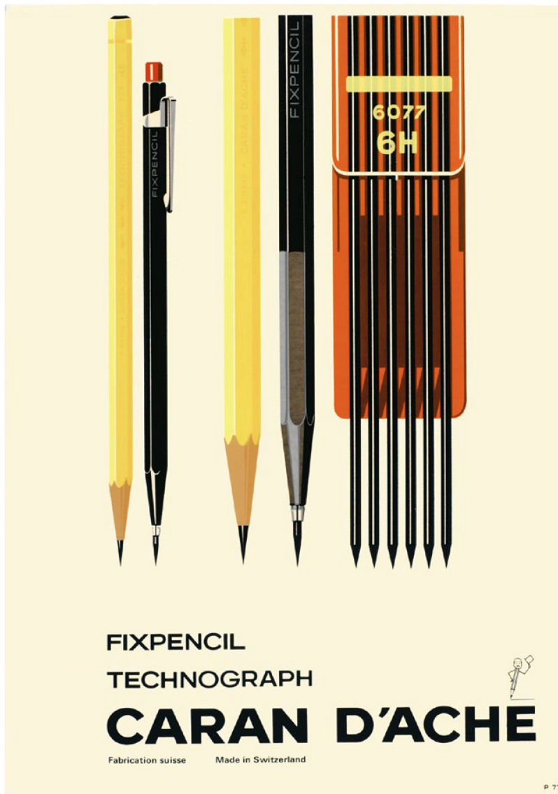
Premier porte-mine au monde, le «Fixpencil» fut breveté par l'entreprise en 1930. Il séduisit tout particulièrement les professionnels de la technique.