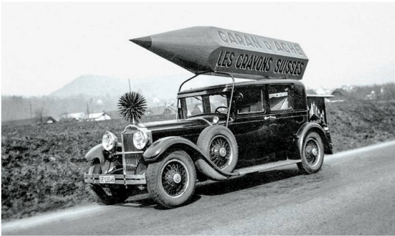
Un crayon comme une fusée: c'est avec cette voiture que les représentants de Caran d'Ache effectuaient leurs tournées publicitaires à la fin des années 1920.