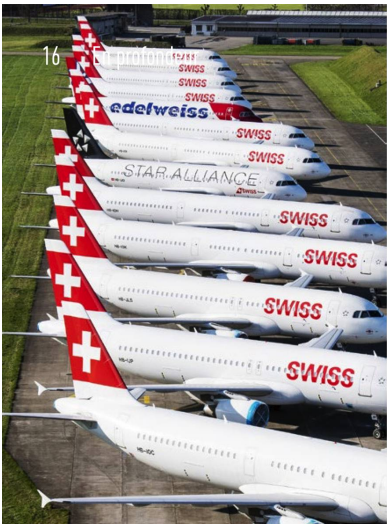
Images frappantes du confinement: la flotte SWISS presque entièrement clouée au sol; le cœur de Lucerne, vidé de ses touristes; les gens qui se ruent chez les marchands de vélos; et le souvenir de journées ensoleillées passées au balcon.