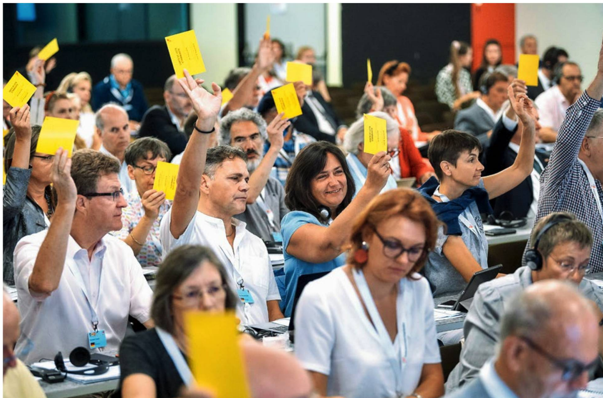
Réunion du Conseil des Suisses de l'étranger à Montreux, qui requiert ici plus de leadership de la part du Conseil fédéral dans le dossier du vote électronique. Photo Adrian Moser (2019)