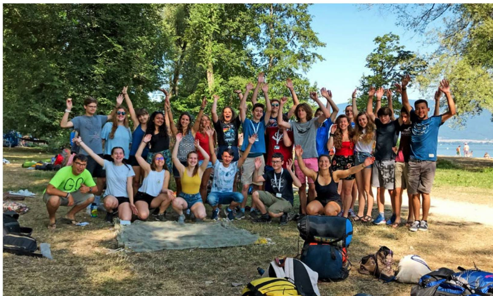
Swiss challenge, Yvonand, 2019.