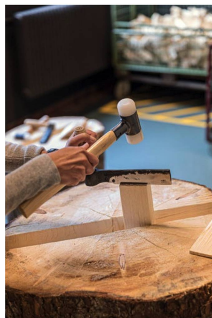
Dans l'atelier de tavillonnage du musée, le public peut se mettre lui-même à l'ouvrage.