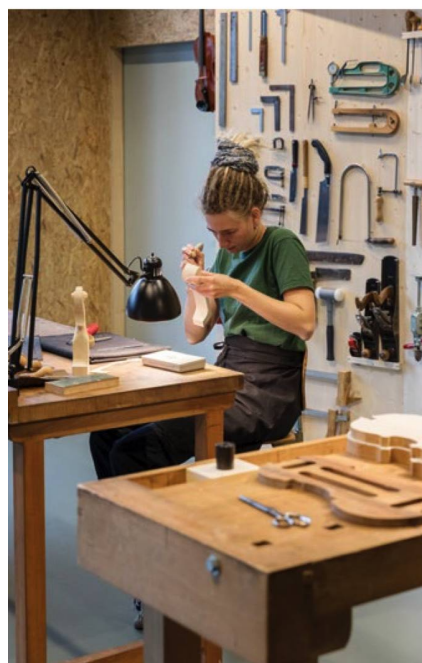
Des apprentis de l'école de lutherie de Brienz montrent leur savoir-faire.

«Atelier Alpes. Créateurs et créatrices», Musée alpin suisse, Berne, jusqu'au 27 septembre 2020. www.alpinesmuseum.ch