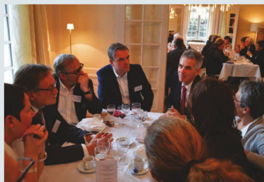
Tous les regards se tournent vers le Consul pour recueillir ses impressions

Voulez-vous vous joindre à nous ? T / 06 80 32 12 01 ou claudemuller38@orange.fr