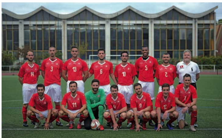
Equipe suisse au chômage technique