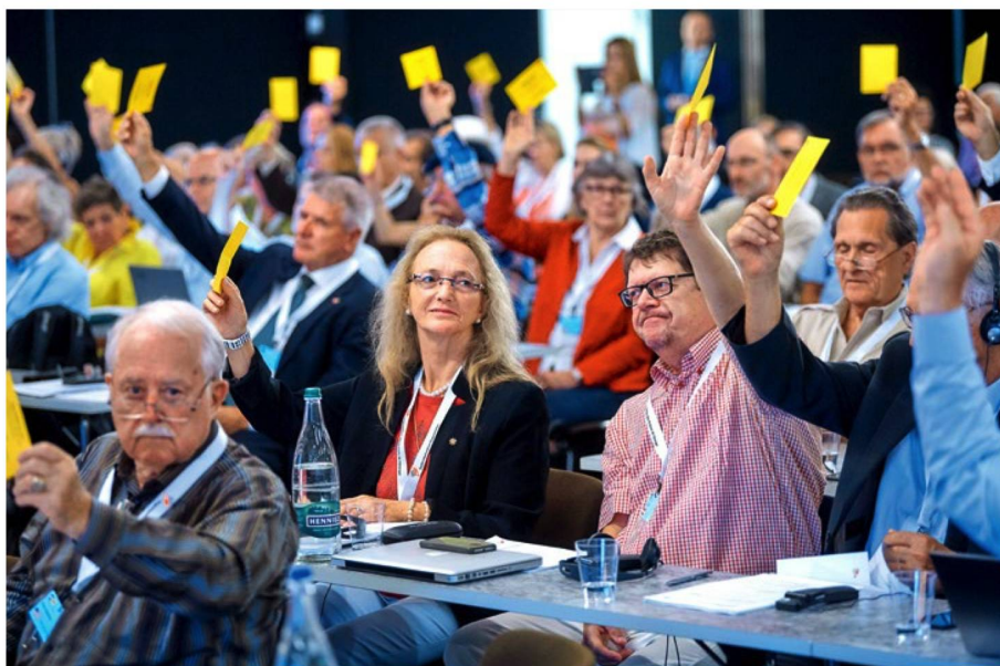
Signaux politiques à Montreux: fort de deux résolutions, le Conseil des Suisses de l'étranger demande au Conseil fédéral d'agir.

Le manifeste électoral approuvé par le CSE contient encore d'autres revendications politiques. Outre le point central, qui est de faciliter l'exercice des droits politiques des Suissesses et Suisses de l'étranger