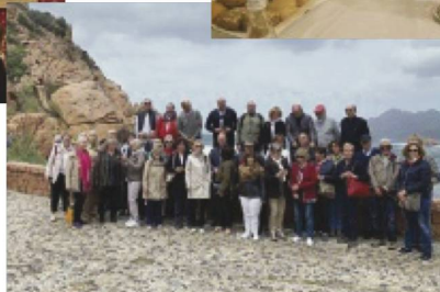
Excursion dans le golfe de Porto