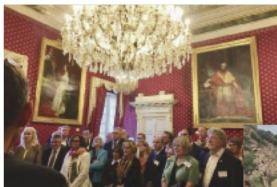
Réception à la mairie d'Ajaccio