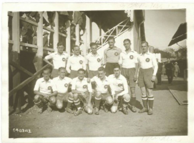
L'équipe fanion de l'USSP de Paris en 1929 devant son Stade de St-Mandé