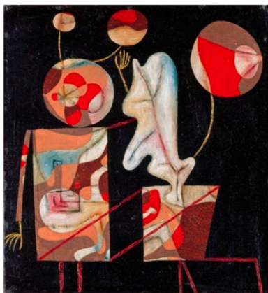
Paul Klee marionnettes 1930, huile sur carton