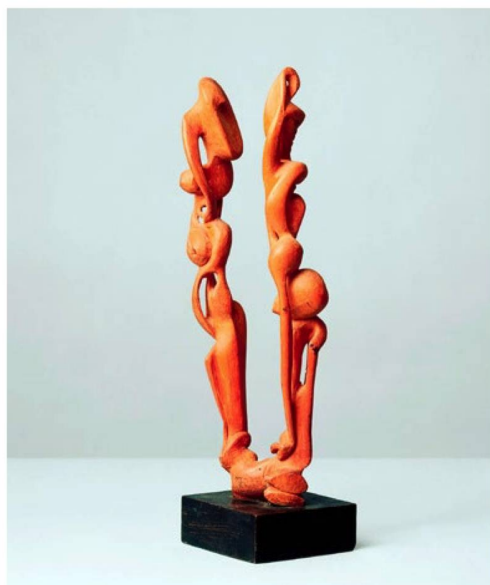
Serge Brignoni Érotique-végétal I, 1933, bois