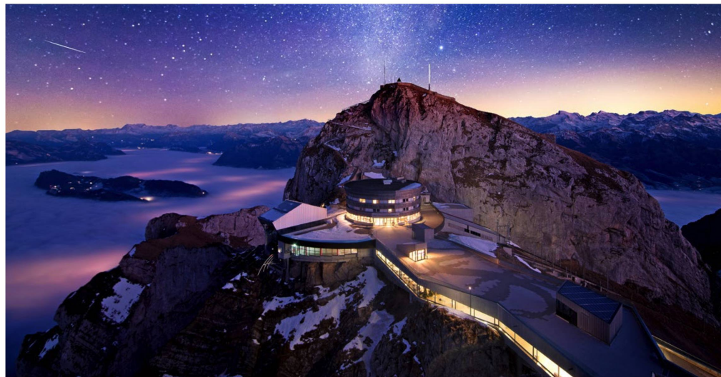
L'hôtel Pilatus Kulm sous un ciel étoilé dans une publicité de Pilatus Bahnen.

À l'instar de Ferdinand Hodler. Ce peintre, dont on célèbre cette année le centenaire de sa mort, a passé régulièrement ses vacances dans l'Oberland bernois dès 1879. C'est là qu'il a peint un grand nombre de ses paysages alpins; en utilisant souvent les mêmes routes et les mêmes points de vue que les touristes. Il a par exemple exploré la région d'Interlaken avec les nouveaux moyens de transport de l'époque. Le train à crémaillère de Schynige Platte l'a conduit aux points de vue sur les lacs de Thoun et de Brienz. Inauguré en 1891, le chemin de fer à crémaillère de Lauterbrunnen à Mürren a offert non seulement une nouvelle attraction aux touristes, mais aussi le motif de carte postale «La Jungfrau» au peintre. Il s'y est rendu pour la première fois en 1895, puis de nouveau durant les étés de 1911 et 1914. Il a peint au total treize variantes du massif de la Jungfrau, présentant évidemment des nuances de couleurs, de contrastes, de textures, d'atmosphère. Mais ces treize variantes ont toutes un point commun: Ferdinand Hodler se trouvait là où étaient les touristes et a peint les différents points de vue depuis différentes gares. Il a pris le train pour observer la Jungfrau comme il le souhaitait.