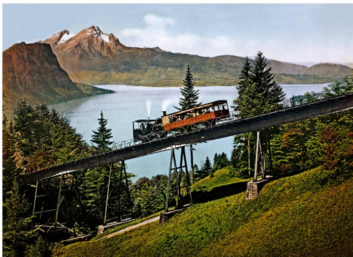
Carte postale en couleurs représentant le train à vapeur à crémaillère de Vitznau sur le Rigi (vers 1900).

«On pourrait dire que tout est nature dans les Alpes. Mais la possibilité de voir cette nature est toujours liée à une infrastructure», déclare Bernhard Tschöfen, spécialiste en sciences culturelles. Il a participé à l'exposition «La beauté des montagnes» à travers laquelle le Musée alpin de Berne présente actuellement l'image typique des Alpes suisses vue par les peintres. C'est un idéal, un cliché populaire qui magnifie les Alpes en tant qu'espace préservé de la civilisation moderne. Selon Bernhard Tschöfen, l'essor des constructions de trains à crémaillère a été systématiquement suivi d'un boom des peintures de montagne. Les artistes ont précisément banni de leurs représentations tout équipement technique grâce auquel ils pouvaient embrasser le regard les montagnes.