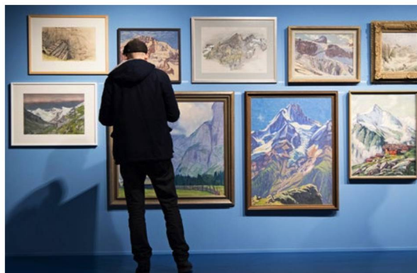
Œuvres exposées au Musée alpin suisse à Berne.

Mark Twain a décrit ce qu'il se passe au sommet: non seulement le légendaire lever de soleil, mais aussi le non moins légendaire attroupement de touristes venus profiter de ce spectacle. Lorsqu'en 1879, il fait l'ascension du Rigi à